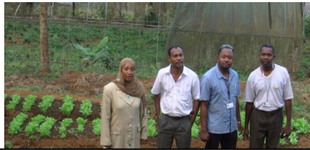
De gauche à droite, Directrice de la solidarité, le Directeur de la CCIA d'Anjouan, le CNP APROJEC sur le terrain