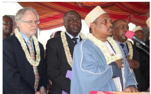
De gauche à droite, le CR-SNU aux Comores, le Directeur Adjoint du BIT, zone Océan Indien, SEM Le Président de l'Union des Comores, au premier plan, lors de l'inauguration de la MDE à Moroni