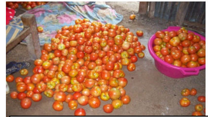
APROJEC : Première récolte des tomates d'un bénéficiaire à Anjouan

Interventions du projet: Suivant cette situation criante des ces jeunes, le projet APROJEC a du créer une synergie entre le marché de la FNAC-FA, mis en place par APROJEC à Moroni et ces jeunes producteurs anjouanais afin que la FNAC-FA puisse assurer la commercialisation des produits provenant d'Anjouan. Après avoir obtenu les revenus de leurs produits, certains ont fait montre de beaucoup de satisfaction, d'autres sont préoccupés par la possibilité de pérennisation de ces genres d'action. Suite à cela, le projet APROJEC a multiplié les efforts pour sensibiliser les autorités comoriennes en vue de mettre en place un mécanisme pérenne de consolidation de la paix par la promotion de l'emploi en faveurs des jeunes. Comme l'a dit un bénéficiaire : « Le retour à la terre devrait être un phénomène de société, car l'agriculture occupe plus de 80% de la population Comorienne ».