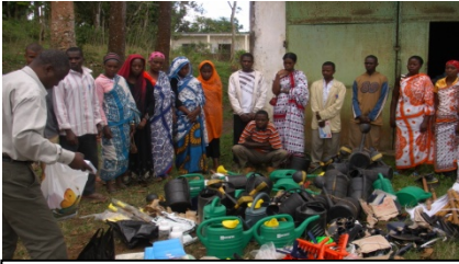
APROJEC : Remise des intrants agricoles par la CCIA d'Anjouan