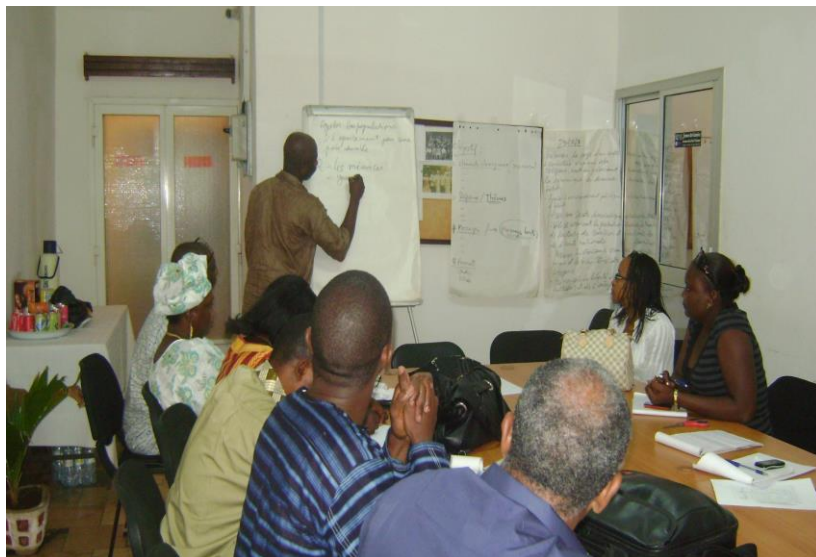
Une séance de formulation de message pour des spots sur la coexistence Pacifique, journalistes, personnes ressources nationales et personnel du PNUD, octobre 2009.

Cette campagne spontanée a permis aux différents acteurs de s'exprimer pour appeler la population à une modération pour éviter les attitudes extrêmes, tout en rappelant que des mécanismes propres de recherche de la vérité et de rétablissement de la justice existent. Cette intervention a contribué à remettre en perspective les dynamiques positives permettant une sortie apaisée de la transition guinéenne. L'initiative a duré d'Octobre 2009 à janvier 2010.