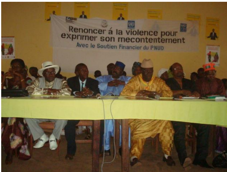
Séance publique de sensibilisation des jeunes des alliances politiques à Conakry