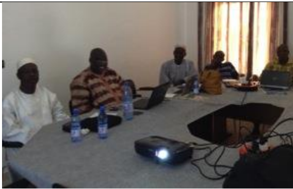
Photo: Vue des participants à l'atelier de finalisation du PROFILES