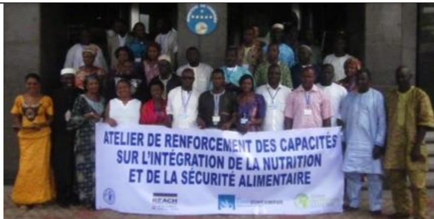
Photo : Vue des participants à l'atelier, Hôtel Radisson le 15 août 2014.