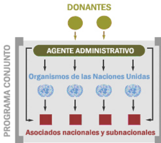
Gráfico ilustrativo de la gestión financiera para un programa conjunto con financiación en serie