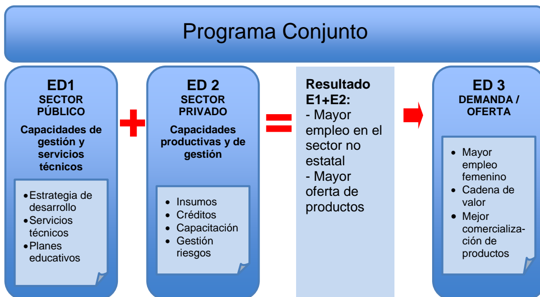
Figura 2: Estructura del programa propuesto

Con este programa conjunto se fortalecerán las capacidades del sector privado en los municipios en función de: la producción y gestión de manera económicamente sostenible; el manejo de riesgo de forma ambientalmente sostenible; y la participación en la estrategia de desarrollo del territorio. Asimismo serán fortalecidas las capacidades del gobierno municipal para proveer servicios al sector privado en función del desarrollo, y elaborar la estrategia de desarrollo.