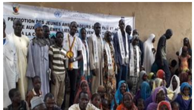
Photo PNUD Cameroun, 2019 : Photo de famille des jeunes ambassadeurs de la Paix de Kobro avec les autres jeunes de la communauté.