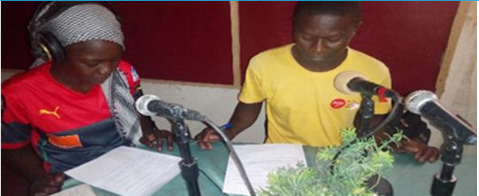
Photo UNICEF Cameroun, 2018 : Jeunes reporters dans une émission radiophonique visant la cohabitation pacifique