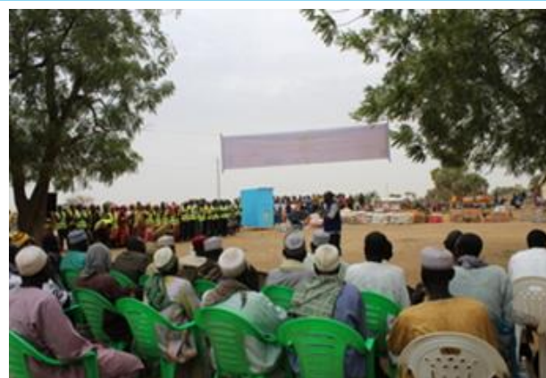
Photo PNUD Cameroun, 2019 : Réunion de concertation sur l'emploi des jeunes et remise des Kits d'insertion socio-économique aux jeunes de Blangoua

Le projet transfrontalier de consolidation de la paix entre le Tchad et le Cameroun dans son objectif de renforcer les capacités économiques des jeunes et des femmes se construit des aspirations conformes aux possibilités économiques objectives à travers les formations aux métiers et l'insertion socio-économique