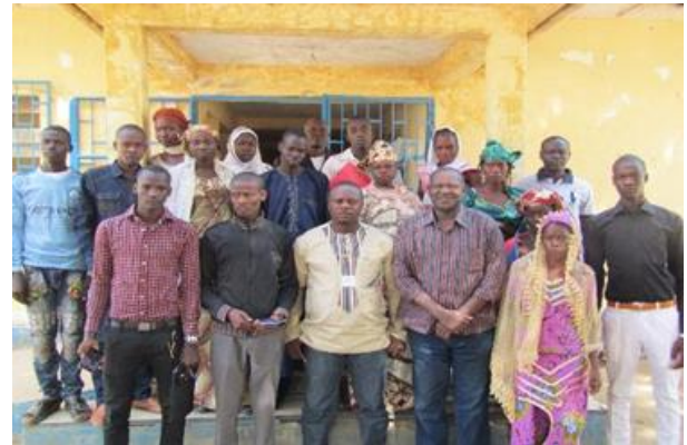
Les jeunes reporters formés à la production et la diffusion des émissions sur la prévention des conflits et de l'extrémisme violent

En outre, 34 séances de dialogue intergénérationnel ont été organisées dans les communes de Blangoua et de Goulfey. Elles ont regroupé des jeunes, des chefs traditionnels et religieux et des leaders de femme. A l'issue de ces dialogues, des résolutions ont été prises en faveur de la culture des valeurs sociales positives, du changement des normes sociales relatives à la masculinité, et de la promotion de la non-violence et de l'égalité hommes-femmes.