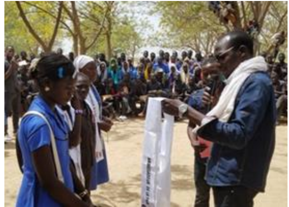
Photo PNUD Cameroun, 2019 : Le Président départemental du CNJC Logone et Chari face aux Jeunes Ambassadeurs de la Paix du Lycée de Blangoua

« Le projet PBSO a stimulé auprès des jeunes le goût des initiatives en faveur de la promotion de la paix, le développement social et économique de nos communautés. Nous dénotons au quotidien, un nouvel engagement fort des jeunes à travers la vie associative, des initiatives de plaidoyer favorisant l'inclusion des jeunes dans les mécanismes de gestion et de résolution des conflits, la sensibilisation sur les leviers de la paix, dont il faut s'occuper, canaliser leur énergie, contribuer au développement de leur localité. » Dit-il