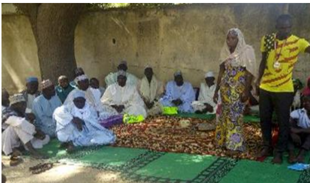
une séance de dialogue de génération à Blangoua

Les activités de communication ont contribué à une réelle adhésion et participation des populations au projet. Les séances de dialogue intergénérationnel et communautaire ont amené les jeunes et les plus âgés à apprendre les uns des autres, à mieux se comprendre et à dialoguer. Les communautés ont pris conscience de l'impérieuse nécessité de construire et de consolider ensemble la paix.