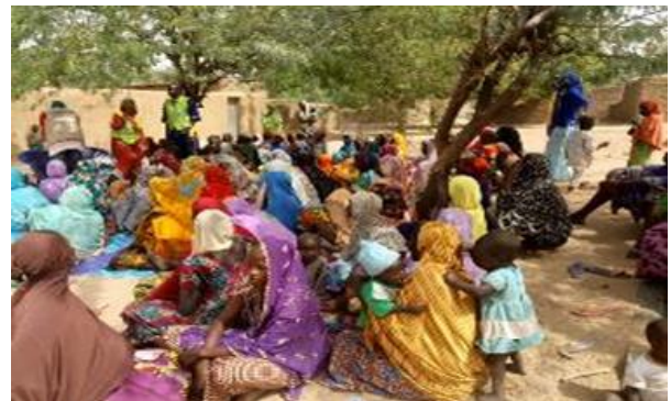
une séance de dialogue communautaire à Saboura dans la localité de Kopro, commune de Blangoua

Un forum regroupant 67 leaders traditionnels et religieux, les jeunes reporters, les leaders de jeunes et de femme a été organisé à Goulfey. Au cours de ce forum, les leaders traditionnels et religieux ont pris des engagements. Il s'agit de la prise en compte de l'aspect genre et la participation des femmes dans les différents processus de prise de décision dans la vie de la communauté; de la sensibilisation des communautés sur la l'égalité des genres et l'équité