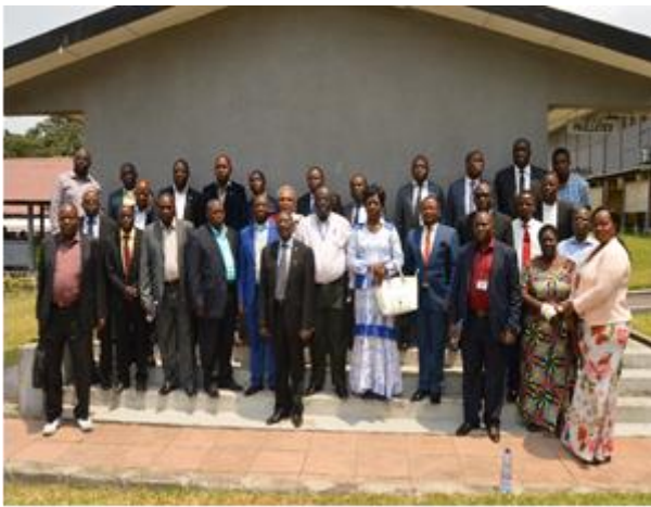
Assemblée Générale de l'APROCEC Aout 2018

Enfin, le Projet ACTIF en partenariat avec l'ONU Femmes a organisé un atelier technique sur l'Institutionnalisation du Genre dans le cadre des plans d'action des deux Associations professionnelles. Ainsi, 21 responsables des IMF et COOPEC dont 7 femmes ont été regroupés en focus groupes pour identifier les actions prioritaires et adopter des mesures concrètes dans le domaine de légalité des sexes pour les deux prochaines années.