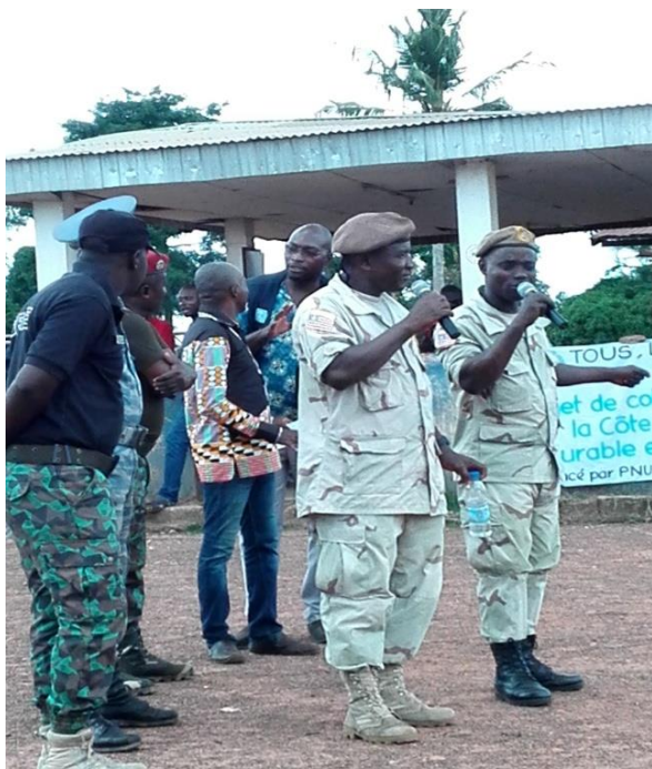
Prise de parole des forces Libériennes lors de la sensibilisation à Daobly