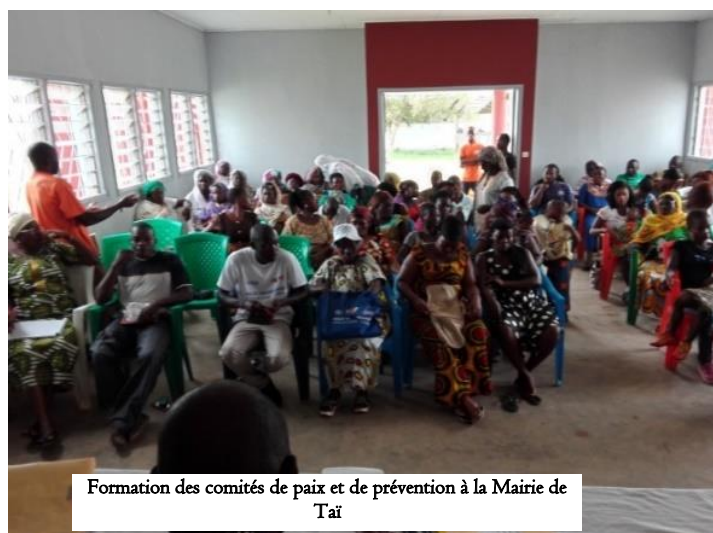
Formation des comités de paix et de prévention à la Mairie de Taï