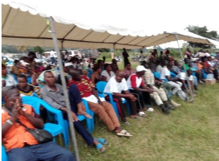
Activité de sensibilisation à Ponan-Taï