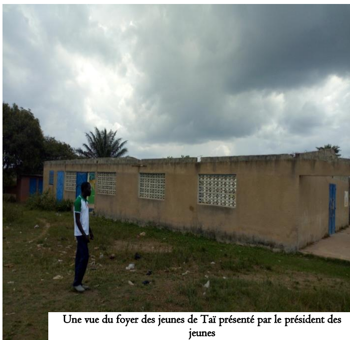
Une vue du foyer des jeunes de Tai présenté par le président des jeunes