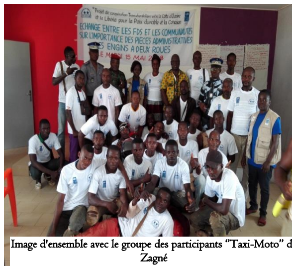
Image d'ensemble avec le groupe de participants "Taxi-Moto" de Zagné

Ce vendredi 18 Mai 2018, s'est tenu dans la salle de réunion de la mairie de Taï, l'atelier de renforcement des capacités des membres du bureau du CCM de Taï. Il était question de former les membres du CCM de Taï en droits de l'Homme, citoyenneté et respect des autorités en vue de développer leurs connaissances, attitudes et aptitudes à collaborer et à participer aux questions relatives à la sécurité dans le respect des droits de l'homme. De façon spécifique, au terme de la formation, les participants devraient être capable d'appréhender les notions de citoyenneté, de civisme et le respect des droits de l'homme et des symboles et institutions de l'Etat comme conditions essentielles d'une bonne collaboration dans la communauté et entre membres du CCM et avec les autorités.