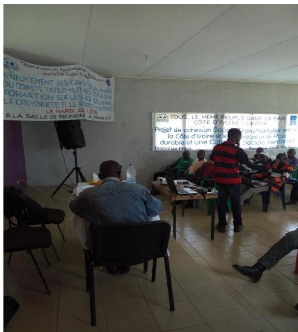
Formation des membres des CCM