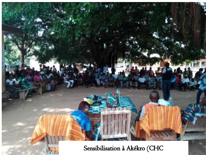
Sensibilisation à Akékro (CHC)

Notons que l’ONG Kouadi a pris une part active au forum public organisé par le PNUD, le Mardi 16 Avril à Daobly et Ponan. En effet, l’ONG a mobilisé les communautés de ces 02 localités pour leur présence massive et aussi la communauté Libérienne de Tembo pour sa participation.