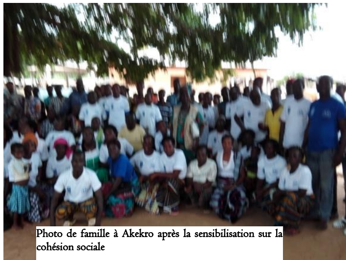
Photo de famille à Akekro après la sensibilisation sur la cohésion sociale