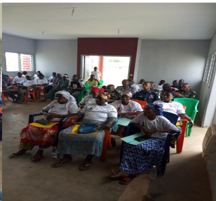
Une vue de la session d'échange entre les Forces de Sécurité et de Défense avec les représentants des commerçants du département de Taï