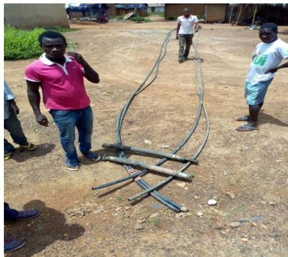
Les pièces défectueuses sont en train d'être démontées en vue de leur remplacement.