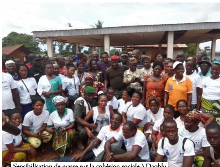
Sensibilisation de masse sur la cohésion sociale à Daobly

Domaine d’activités 2 : Rapprochement communautaire à travers les activités socioculturelles et sportives