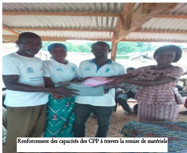
Renforcement des capacités des CPP à travers la remise de matériels