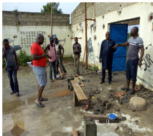
Visite de Monsieur le Ministre et Maire de Taï pour constater le début effectif des travaux de réhabilitation du foyer des jeunes de Taï

La charpente a été complètement reprise, de même que l'électricité de tout le bâtiment. Les portes également réparées et nous avons changé toutes les serrures. En somme c'est un foyer complètement rénové et équipé qui est désormais offert à la jeunesse du département de Taï (Voir quelques images en annexe du rapport).