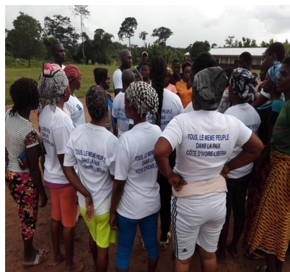
L'Equipe féminine venue du Libéria (Glario)