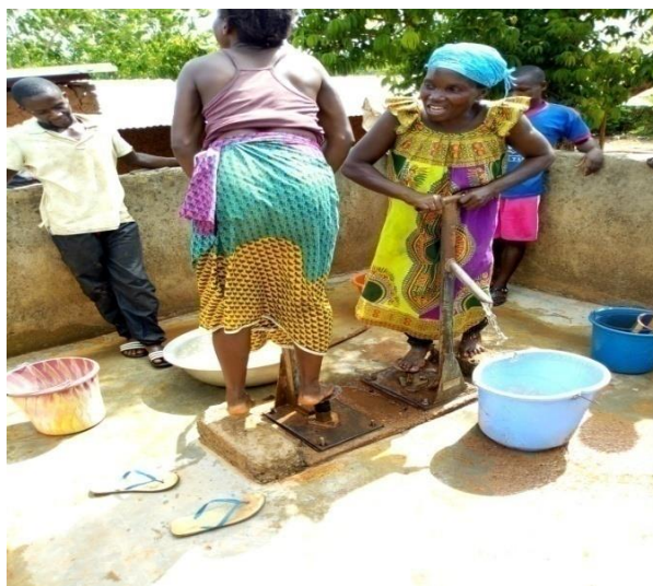
La jeunesse de Daobly (Femmes et garçons) exprimant leur joie de voir l’eau coulée à nouveau dans les pompes du village