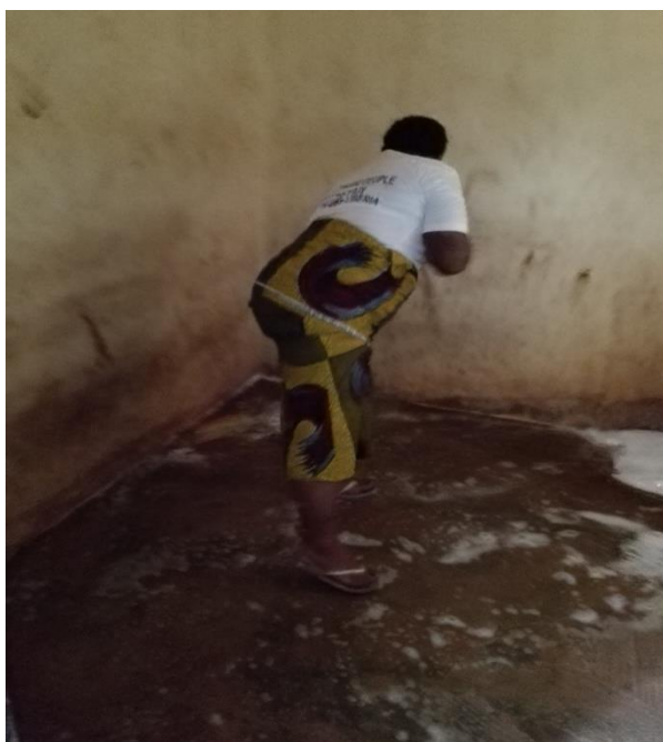
Nettoyage de la salle de garde à vue des personnes en situation de détention provisoire