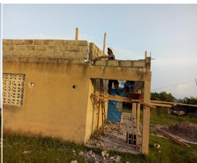
Une vue d'ensemble des travaux de réhabilitation du foyer

corsé. Toutes les fissures observées au niveau de la terrasse ont été rattrapées. L'estrade qui fait office de podium a été aussi refaite. (Voir les photos en annexe au rapport)