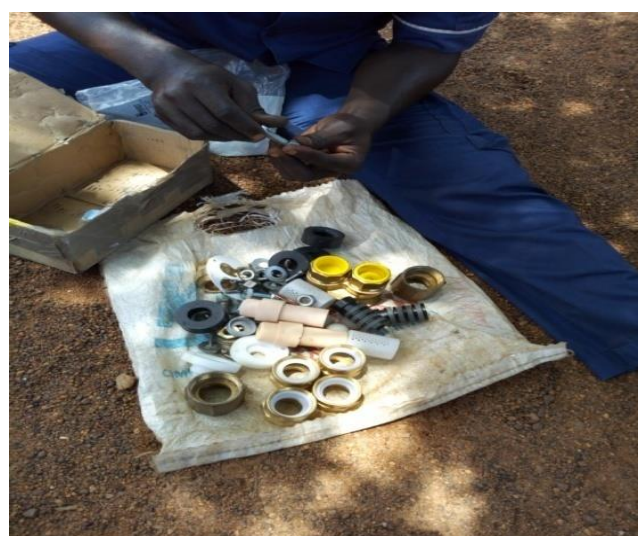
Une vue des nouvelles pièces acquises par le technicien

Il faut souligner qu'il n'était pas question de réparer une quelconque pièce défectueuse mais plutôt de la remplacer car selon le technicien, les pompes sont restées longtemps sans entretien (depuis 2013). Ainsi plusieurs éléments comme les pistons, les bagues, les joints, boudruche... Ont été remplacés par de nouvelles pièces rendant alors les 02 pompes de Daobly fonctionnelles. L'eau potable est désormais disponible pour la communauté de Daobly. Elle (communauté) était toute en joie au vu des premières gouttes d'eaux jaillissant des pompes. Le chef du village a profité de notre présence pour remercier le PNUD et l'ONG Kouadi. Aujourd'hui, lundi 07 Mai 2018 , restera un jour mémorable pour lui et sa communauté car depuis le mois de Janvier 2018, l'eau potable a cessé de couler à Daobly.