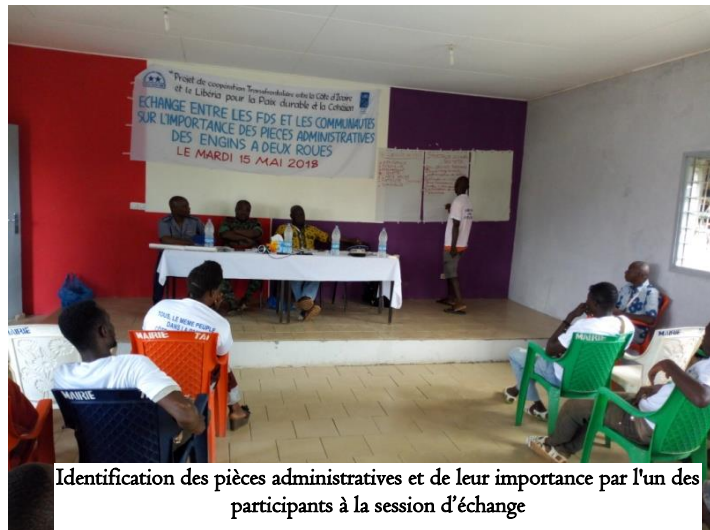
Identification des pièces administratives et de leur importance par l'un des participants à la session d'échange