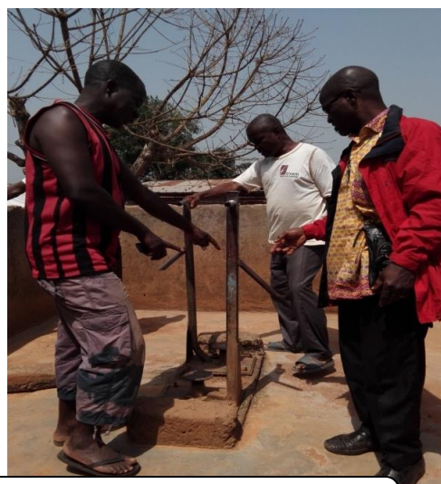
Les 02 pompes de Daobly présentées par la chefferie traditionnelle à l'équipe projet de l'ONG Kouadi lors de l'identification des besoins communautaires