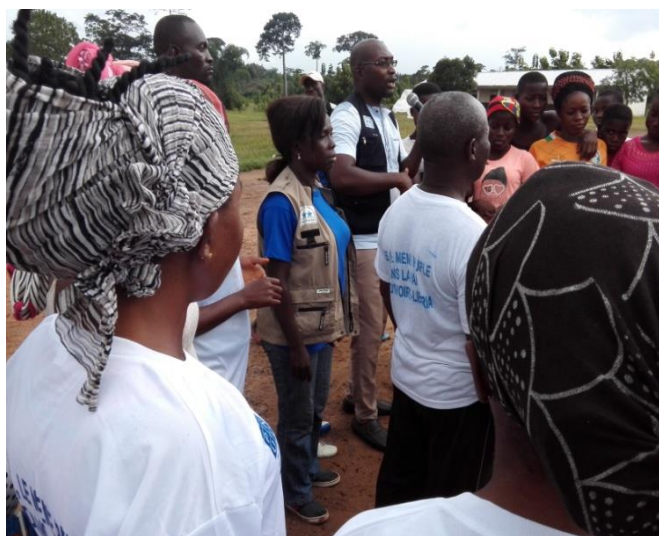
Messages de cohésion sociale adressés aux différentes équipes

La communauté Libérienne s'est réjouie de l'organisation de ces activités en territoire ivoirien, elle a par contre déploré le manque de telles initiatives chez elle au pays. Pour elle, de telles activités sont non seulement faites pour rapprocher les communautés qui longtemps se sont combattues mais surtout de briser tous les murs de méfiance créés par les crises.