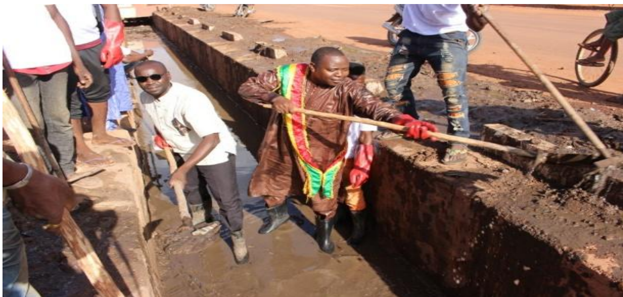
Figure 1 Image HIMO Bamako

Les secteurs d'intervention des HIMO ont été définis dans le document de projet : réhabilitation d'ouvrages hydrauliques (forages, puits), d'infrastructures communautaires (écoles, centres de santé, foyers de jeunes, cimetières...), assainissement des lieux publics, curage de caniveaux, reboisement et autres en fonction des réalités spécifiques de chaque zone de projet.