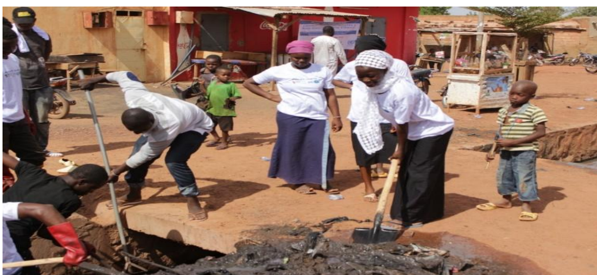
Figure 2 Image Ségou

Dans le district de Bamako, les initiatives retenues par communes sont les suivantes : réhabilitation de forage/commune1, curage de caniveaux/commune2 réhabilitation du siège du conseil communal de la jeunesse/commune3, réhabilitation de l'espace de loisirs du foyer de jeunes/commune4, réhabilitation de la salle de soins du CSCOM-BACO/commune5 et enfin réhabilitation d'un forage/commune6. A Ségou deux initiatives d'assainissement ont été retenues pour Ségou ville et Niono et l'adduction au foyer des jeunes de Bla.