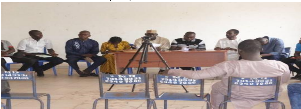
Fig. 1 : Causeries-débats rive gauche

Les causeries –débats organisées avec les organisations de jeunes visaient à informer, échanger et à sensibiliser les jeunes, mais aussi le grand public sur les questions de radicalisation et d'extrémisme violent et du rôle que pourraient jouer les jeunes dans la lutte contre le fléau. Les causeries-débats animées par des personnes –ressources du Ministère des Affaires Religieuses et du Culte et de radios identifiées sur la base de leurs expériences. Les causeries –débats ont été diffusées dans les radios de proximité et nationales.