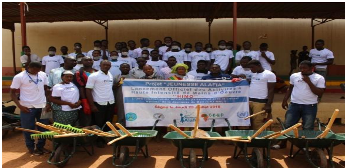
Figure 3 Image Mopti

Les images pour les régions de Tombouctou, Gao, Ménaka et Kidal et Taoudéni se trouvent encore l'équipe du projet rentrée du terrain hier.