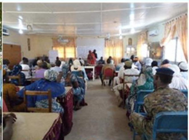
Photo de famille des participants (A gauche). Une vue des participants à la session (A droite)

« Soutenir les mécanismes de consolidation de la paix au niveau communautaire et l'inclusion des jeunes dans les zones frontalières entre le Tchad et le Cameroun »