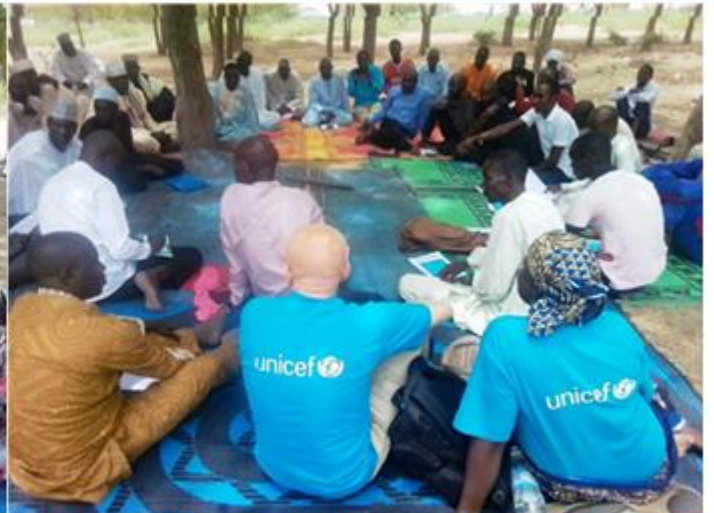
Photo (A gauche) UNICEF Cameroun, 2019 : Session de dialogue entre les jeunes filles et les femmes plus âgées Photo (A droite) UNICEF Cameroun, 2019 : Session de dialogue entre les jeunes garçons et les hommes plus âgés

« Soutenir les mécanismes de consolidation de la paix au niveau communautaire et l'inclusion des jeunes dans les zones frontalières entre le Tchad et le Cameroun »