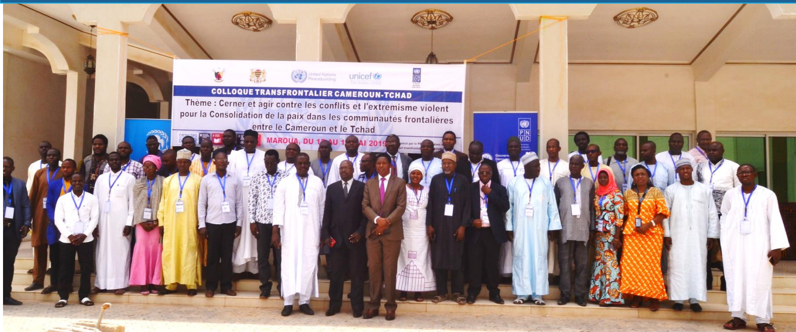
Photo PNUD Tchad, 2019 : Photo de famille après l'ouverture officielle du colloque international tenu à Maroua du 15 au 16 mai 2019