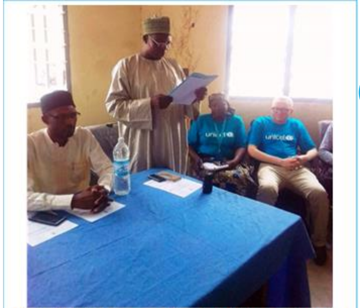
Photo UNICEF Cameroun 2019 : Le Maire de Blangoua disant le mot de bienvenue aux participants

Cette activité a été couverte par les radios partenaires CRTV FM de Kousséri et Radio Karal du Tchad et les jeunes reporters de Blangoua. Il est important de souligner le soutien très remarquable des autorités administratives et communales du Cameroun et du Tchad pour la conduite des consultations communautaires préliminaires et des séances de dialogue proprement dites, la restitution en plénière suivie de la clôture solennelle des activités.