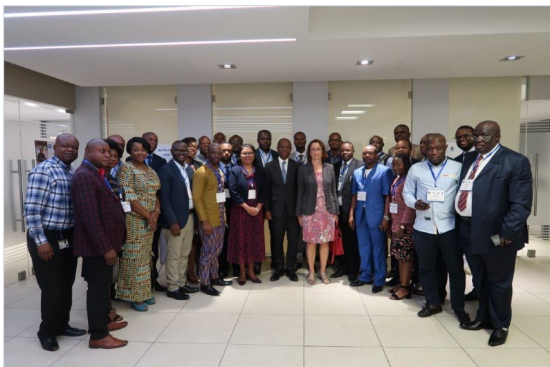
Atelier de formation sur les opportunités de la finance digitale pour le secteur de la microfinance en RDC - 23-24 Juillet 2019, Kin Plaza Rotana, Kinshasa Photo de groupe : avec au centre le Représentant Résident du PNUD et la Cheffe de Coopération Suède