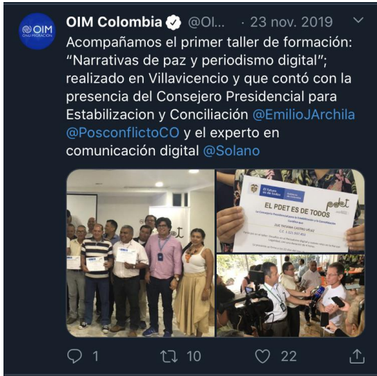
Tweeter de la OIM sobre el taller de periodistas en Villavicencio adelantado por la Consejería de Estabilización con recursos del MPTF