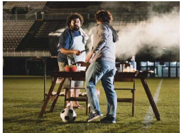
Filmación de Paremos la Pelota