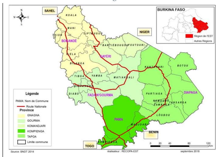
Carte 1: Carte administrative de la région de l'Est