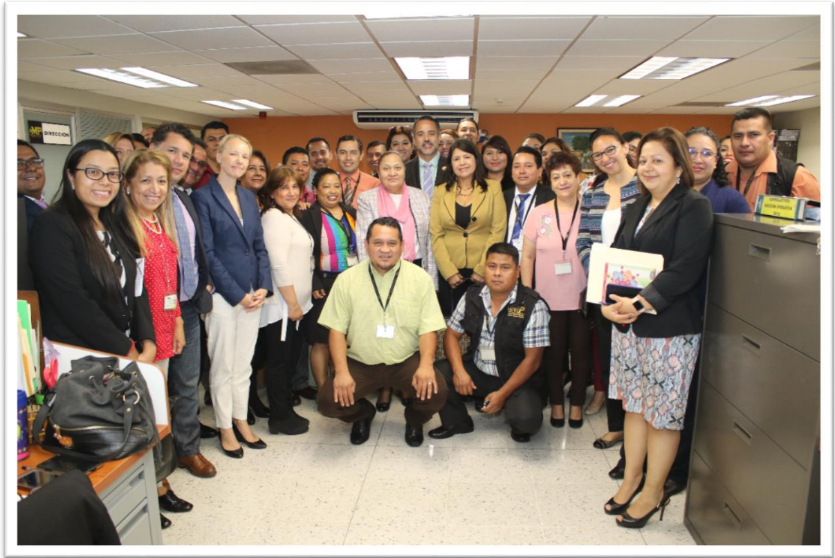
10.08.18 Miembros del Comité Ejecutivo y personal técnico de los proyectos PBF y del MP en las instalaciones renovadas del OPSP.