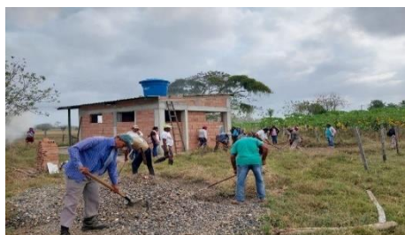
Figura 6. Instalación y puesta en marcha centro de acopio y enfriamiento de leche valencia Córdoba.

Para el municipio de valencia se acompañó todo el proceso de adecuación, instalación y puesta en marcha del centro de acopio (figura 6). Así mismo, en articulación con AGROSAVIA se implementan una parcela demostrativa por municipio con extensión de 3ha cada una y enfocada al modelo de ganadera sostenible. (este modelo incluye acciones enfocadas a SAN) con transferencia de conocimiento a las familias beneficiarias del programa conjunto.