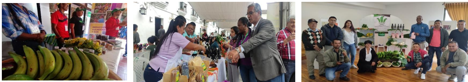
Figura 10. Actividades desarrolladas de la estrategia de mercados implementada por el programa conjunto