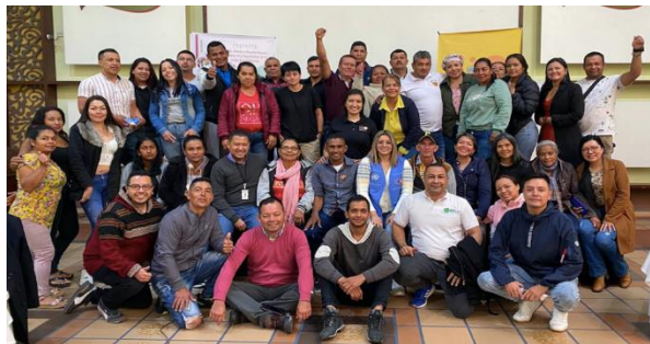
Figura 12. Intercambio de buenas prácticas de fortalecimiento del Tejido Social Córdoba y Nariño