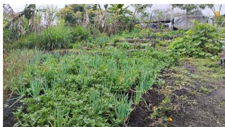
Figura 2. Incorporación de actividades SAN en las unidades productivas familiares

La tabla 1, muestra las principales líneas generadoras de ingreso a nivel familiar (15 líneas productivas) fortalecidas, capitalizando habilidades en base a la vocación agropecuaria y experiencia de los productores, factores agroambientales, así como, a las necesidades del mercado. Las inversiones a nivel familiar se enfocaron en un porcentaje asociado a líneas agrícolas del (16%) y líneas pecuarias (84%); contribuyendo así, a la sostenibilidad de los procesos productivos con un importante énfasis en Seguridad Alimentaria y Nutricional – SAN, como se observa en la figura 2.