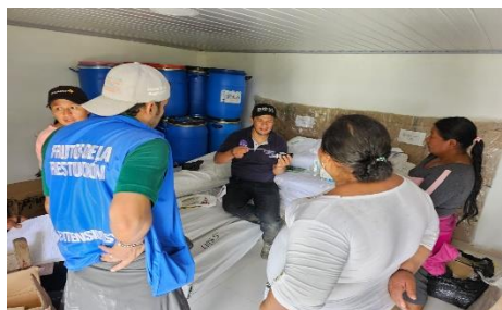
Figura 7. Actividades desarrolladas en torno a la línea productiva de café

FONDO MULTIDIMENSIONAL DE LAS NACIONES UNIDAS PARA EL SOSTENIMIENTO DE LA PAZ