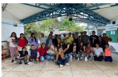
Figura 11. Módulos de Escuela de ODS en municipios de Nariño: Los Andes y Policarpa

Como resultados del proyecto y a través de las Escuelas de ODS y Escuela de Gestores de Cambio y con el acompañamiento de la Universidad de Córdoba, la Universidad del Cauca y la Universidad Cooperativa de Colombia, se realizaron procesos de formación a 260 líderes sociales para fomentar el liderazgo de sus comunidades en temas de participación, gobernanza e incidencia, VBG y Agenda 2030 y ODS, con metodologías participativas que han permitido la socialización y transmisión de conocimientos a familias beneficiarias y comunidad aledaña; durante estos ejercicios se identificaron 121 agentes de cambio en los seis municipios focalizados (48 hombres y 73 mujeres, entre ellos 14 jóvenes), a través de un proceso de fortalecimiento de capacidades que constituyó la base para fortalecer capacidades técnicas en temas de la Agenda 2030, gestión del cambio y abordaje integral de las violencias basadas en género. La figura 11 muestra algunas de las acciones desarrolladas.