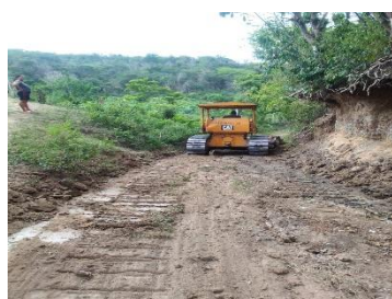
Figura 4. Rehabilitación de reservorios en el municipio de Carmen de Bolívar

Por ultimo y como una acción complementaria al desarrollo de acciones enfocadas a ganadería sostenible, en articulación con AGROSAVIA, se implementan 3 parcelas demostrativas y formaciones teórico-prácticas (una por organización) con extensión de 2,0 a 3,0 hectáreas cada una enfocada al modelo de ganadera sostenible, este modelo, además, incluye acciones enfocadas a SAN.