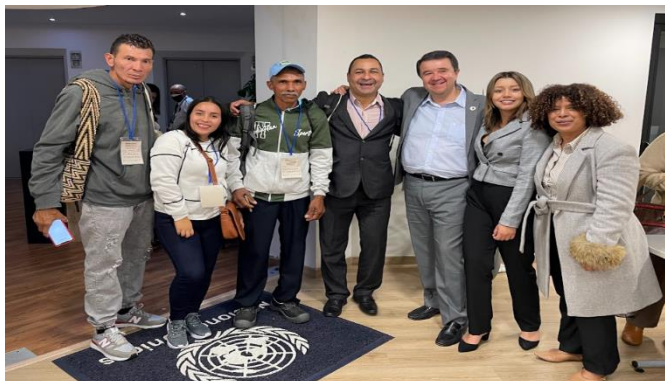
Figura 13. Evento Voces del Tejido Social en Bogotá, Equipos de El Carmen de Bolívar, Policarpa y Los Andes.