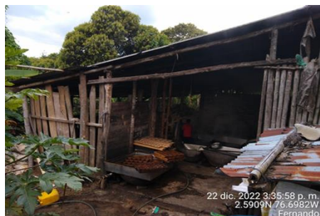
Figura 8. Instalación y puesta en marcha centro de acopio y enfriamiento de leche valencia Córdoba

Para el modelo asociativo enfocado a la producción de panela liderado por la “Asociación agropecuaria de productores y comercializadores panelera de Cajibío”, el fortalecimiento giró en torno al mejoramiento de la inocuidad y calidad de los procesos de producción a través de la adecuación de la infraestructura de 11 trapiches familiares de uso comunitario como se observa en la figura 8. Estas adecuaciones definidas de manera estratégica y acorde al recurso disponible, consisten en la implementación de pisos y muros repellados que anteriormente eran en arena y tabla respectivamente, con secciones de trabajo diferenciadas y separadas como: área de moldeo, de bodega, de calderas, de baño (estas áreas no existían inicialmente), adecuaciones en los hornos sellando fisuras que permiten mayor eficiencia la energía térmica que circula hacia los hornos de cocción de los jugos de la caña.