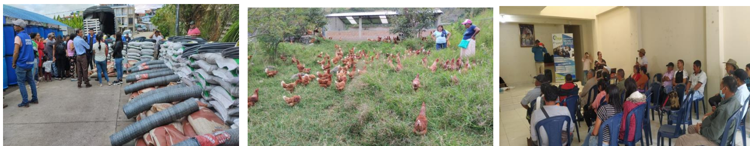
Figura número 9. Actividades desarrolladas en los municipios de Policarpa y los Andes Sotomayor