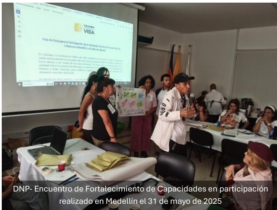
DNP- Encuentro de Fortalecimiento de Capacidades en participación realizado en Medellín el 31 de mayo de 2025