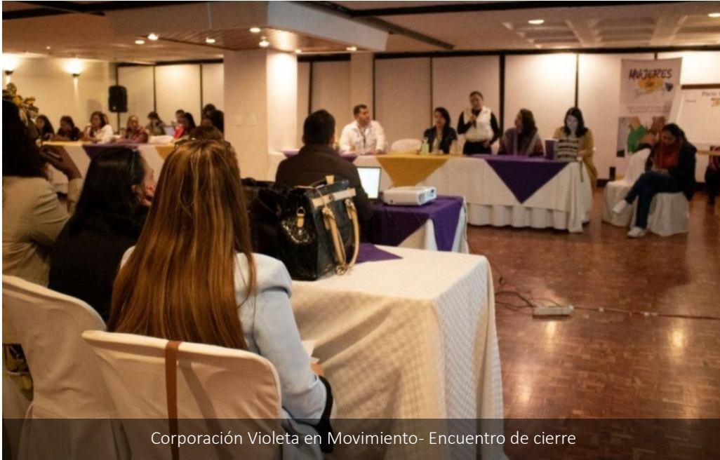
Corporación Violeta en Movimiento- Encuentro de cierre