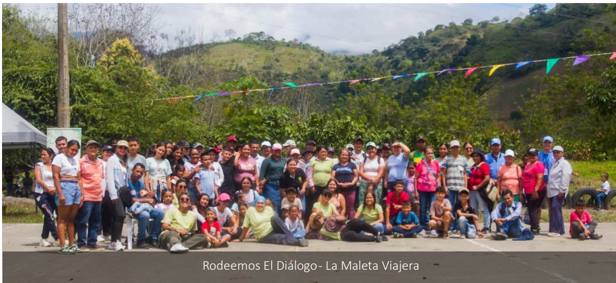
Rodeemos El Diálogo- La Maleta Viajera