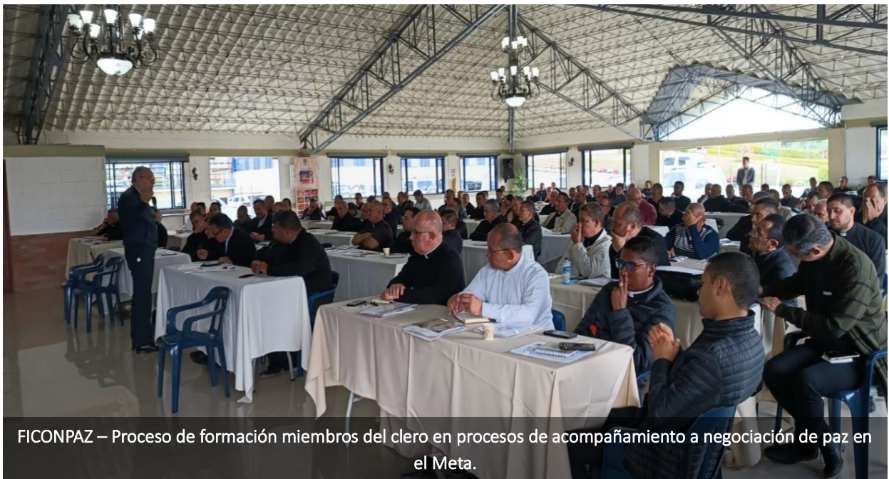
FICONPAZ – Proceso de formación miembros del clero en procesos de acompañamiento a negociación de paz en el Meta.