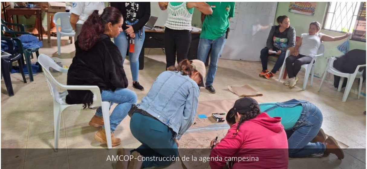
AMCOP- Construcción de la agenda campesina