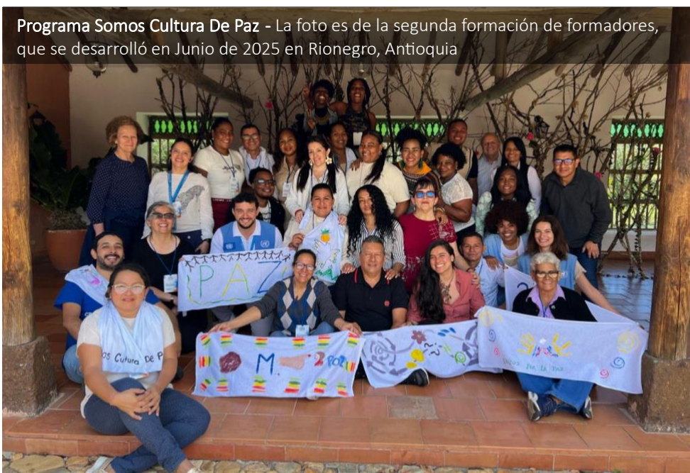
Programa Somos Cultura De Paz - La foto es de la segunda formación de formadores, que se desarrolló en Junio de 2025 en Rionegro, Antioquia