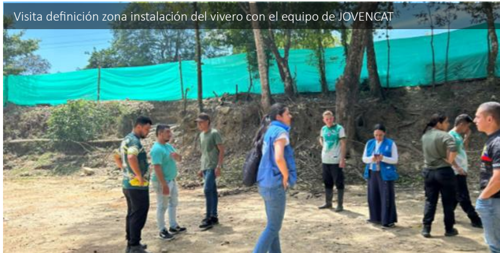
Visita definición zona instalación del vivero con el equipo de JOVENCAT