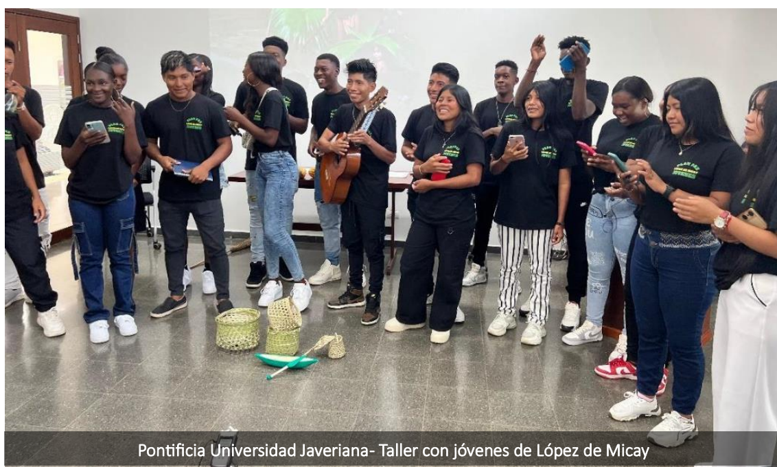
Pontificia Universidad Javeriana- Taller con jóvenes de López de Micay