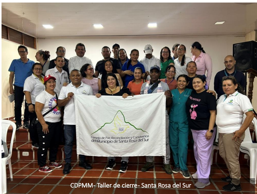
CDPMM- Taller de cierre- Santa Rosa del Sur