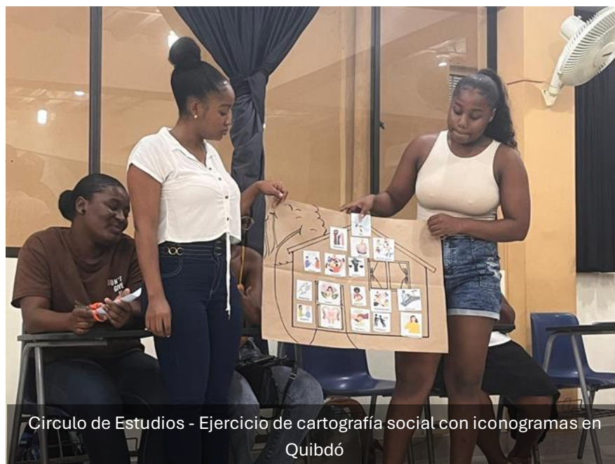
Círculo de Estudios - Ejercicio de cartografía social con iconogramas en Quibdó