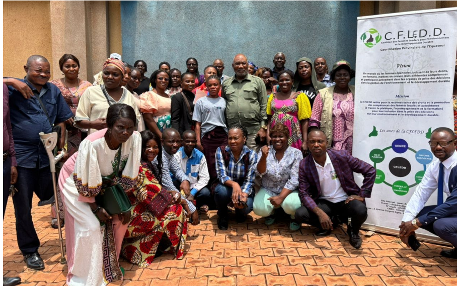
Concertation d'une organisation des femmes sur la politique forestière dans l'Equateur

Y a-t-il eu des obstacles sur le plan de la préparation et la mise en œuvre de ces activités ? Comment le projet les a-t-il surmontés ?