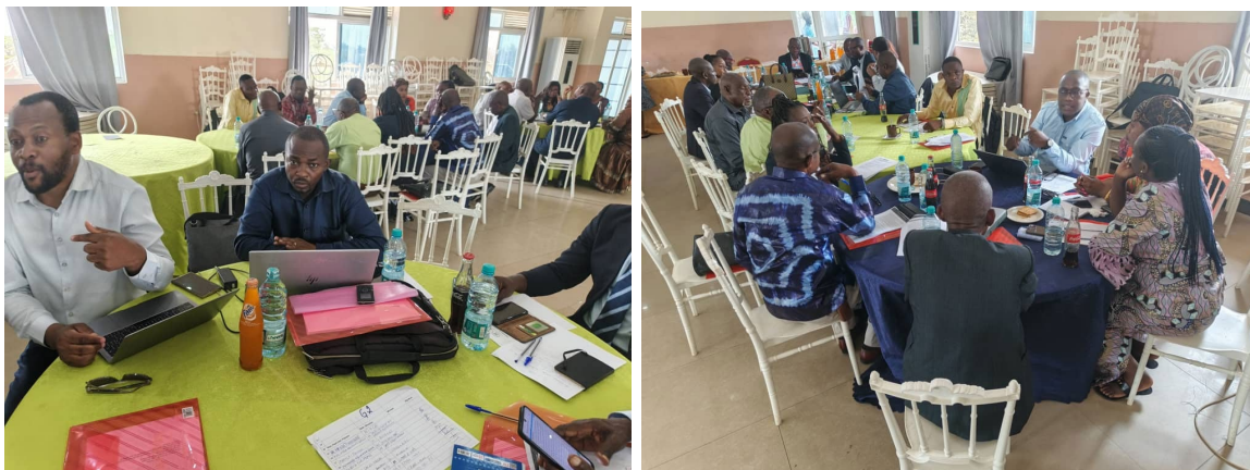
Sensibilisation et consultations des parties prenantes sur la politique forestière dans le Haut Katanga

La sensibilisation de haut niveau de plus de 1 143 personnes sur la politique forestière nationale dans 25 provinces de la République Démocratique du Congo et environ 200 personnes en ligne a permis de mieux communiquer sur les activités du projet. Au-delà de ces personnes sensibilisées au travers des ateliers, d'autres communications ont été développées à travers les presses locales audiovisuelles et écrites.