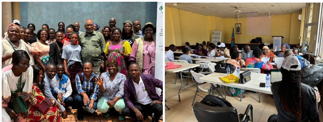
Consultations des femmes et autres acteurs de la société civile sur la politique forestière dans le Kongo central

Sur la politique forestière nationale, la communication a également eu lieu à travers les consultations en ligne (environ 200 personnes consultées) à travers le site du ministère de l'environnement, développement durable et nouvelle économie du climat ainsi que sa page facebook .