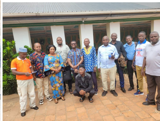
Consultations des personnes ressources au niveau provincial sur la politique nationale de population et le profil démographique