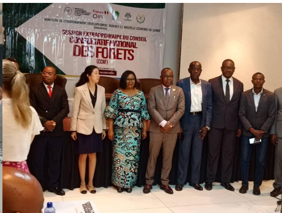
Conseil consultatif national des forêts, session extraordinaire sur la validation de la feuille de route sur le code forestier