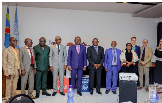
Atelier de validation finale des livrables de l'étude sur le potentiel agricole de la RDC Kinshasa, Hotel Sultani, le 26 juin 2024

Liens : https://drive.google.com/drive/folders/1WtmjMpeQBDDw7hAtIU-qZyTsdMsaDVFI?usp=drive_link