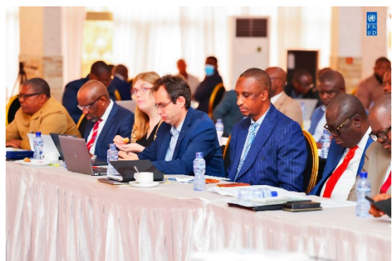
Atelier de restitution et validation des livrables de l'étude sur le capital forestier national Kinshasa, Beatrice Hotel, le 29 juin 2024

Lien : https://drive.google.com/drive/folders/1WtmjMpeQBDDw7hAtIU-qZyTsdMsaDVFI?usp=drive_link