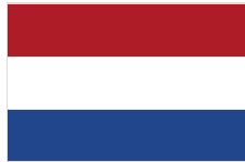
Government of Netherlands