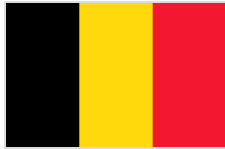
Government of Belgium