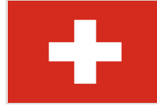
Government of Switzerland