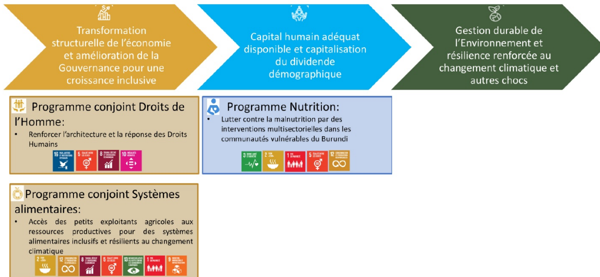
Figure 1: Les programmes conjoints financés par le fonds sont alignés à deux des trois priorités stratégiques du Plan-Cadre de Coopération pour le Développement Durable 2023-2027 signé entre le Gouvernement du Burundi et le Système des Nations Unies.

En 2025, le fonds a soutenu trois programmes conjoints. Ces programmes ont contribué à renforcer les deux premières priorités stratégiques du Plan-Cadre de Coopération pour le Développement Durable 2023-2027.