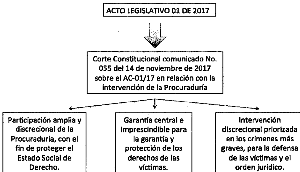
Grafico 2: Esquema del alcance de la PGN en la JEP

Asimismo, la PGN no cuenta actualmente con información histórica unificada, ni con un archivo de conservación de memoria por medio del cual se identifiquen los procesos disciplinarios que conoció y conoce actualmente la entidad respecto de hechos relacionados con violaciones a derechos humanos e infracciones al Derecho Internacional Humanitario por servidores públicos y que requieren ser entregados a la JEP para la presentación de los informes que activen su competencia por procesos disciplinarios relacionados con el conflicto armado que vinculen Agentes del Estado y que solamente podría hacer la PGN.