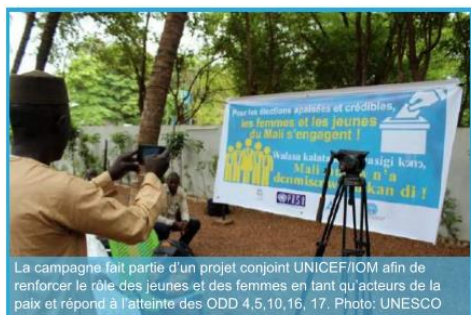
La campagne fait partie d'un projet conjoint UNICEF/IOM afin de renforcer le rôle des jeunes et des femmes en tant qu'acteurs de la paix et répond à l'atteinte des ODD 4,5,10,16, 17.