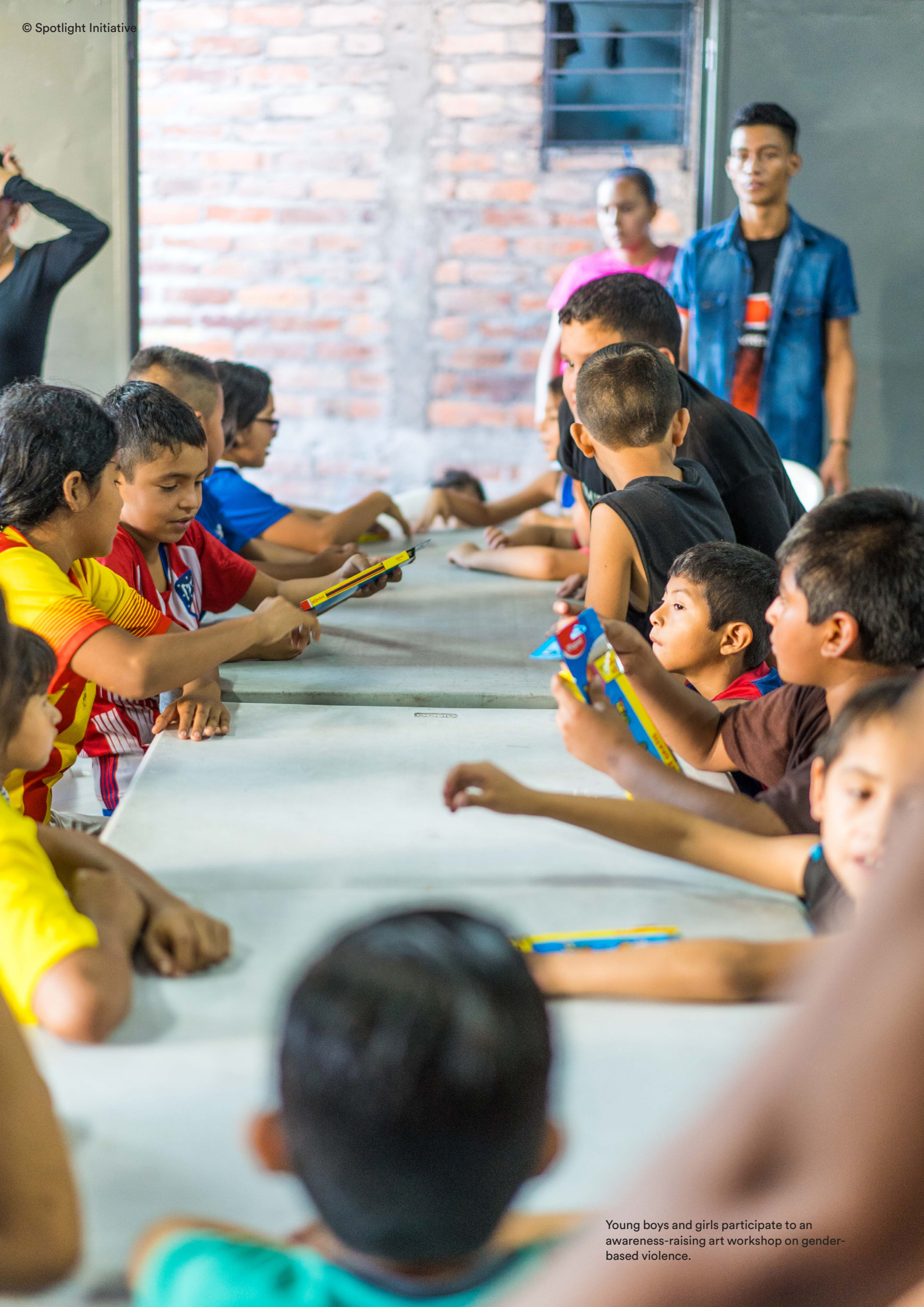
Young boys and girls participate to an awareness-raising art workshop on gender-based violence.