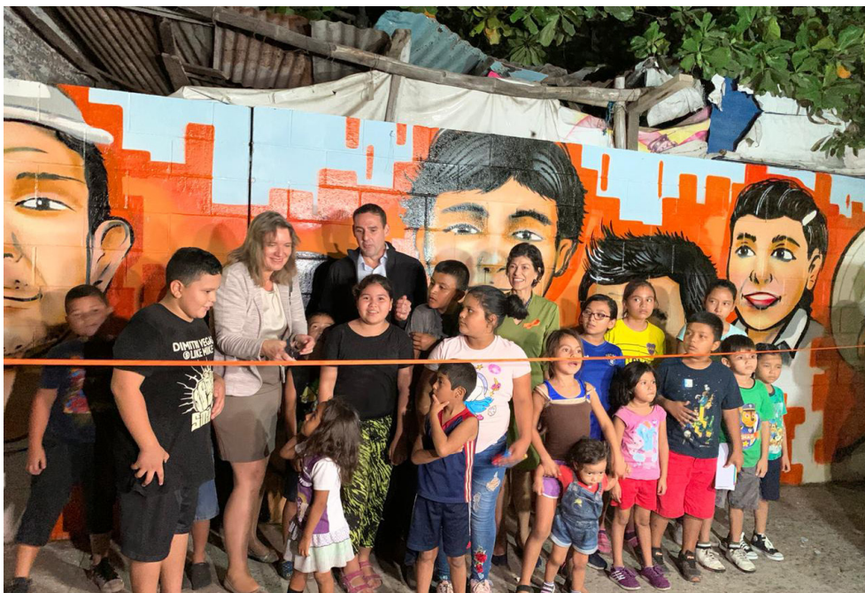
Unveiling of the Spotlight Initiative mural to raise awareness of violence against women and girls.