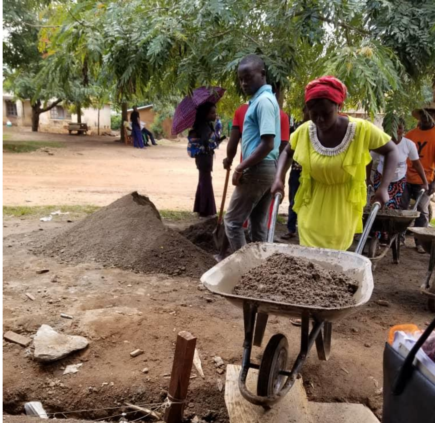
Une jeune femme transporte du ciment pour le dallage du centre des jeunes, Commune de Beu – Beni, Juin 2020