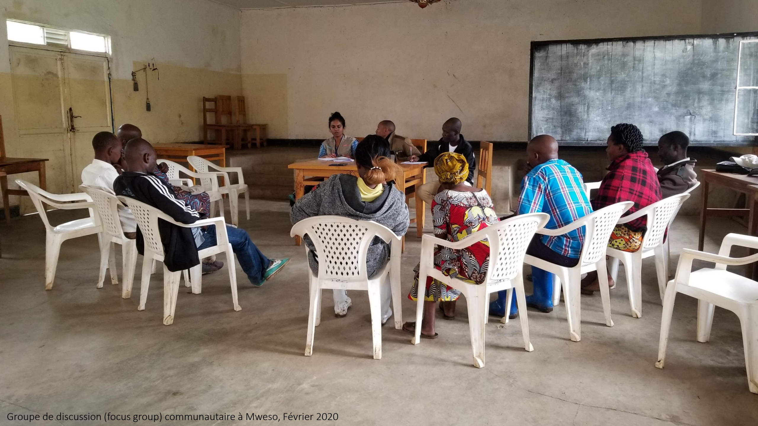
Groupe de discussion (focus group) communautaire à Mweso, Février 2020