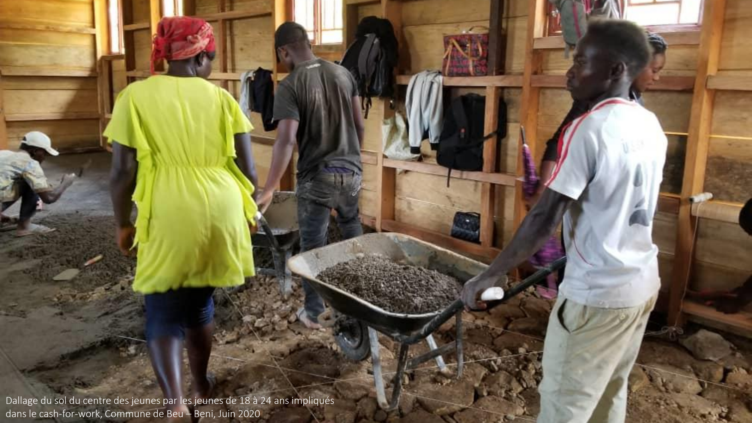
Dallage du sol du centre des jeunes par les jeunes de 18 à 24 ans impliqués dans le cash-for-work, Commune de Beu – Beni, Juin 2020