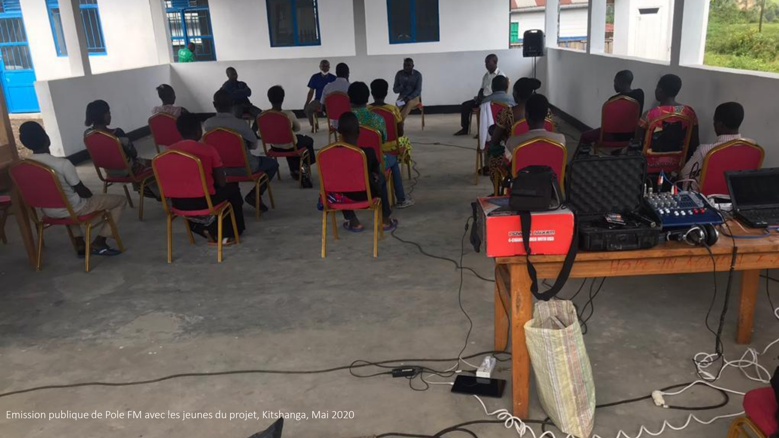
Emission publique de Pole FM avec les jeunes du projet, Kitshanga, Mai 2020